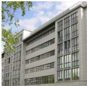
Firmensitz in Berlin/Mitte

„Bisher wurde eKomi ausschließlich von mir privat und von einem Bekannten finanziert. Für die weitere Expansion haben wir vor einigen Monaten auch einen größeren Millionenbetrag von einem renommierten VC aufgenommen, um unser Wachstum in Europa zu beschleunigen. Bei dieser Finanzierung hat auch UHY beratend mitgewirkt und uns sehr unterstützt!“